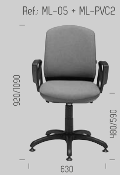
Ref: ML-05 + ML-PVC2