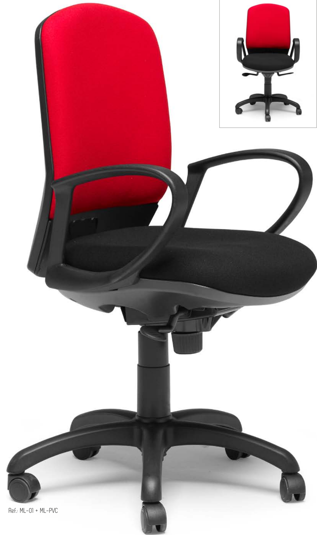
Ref: ML-01 + ML-PVC