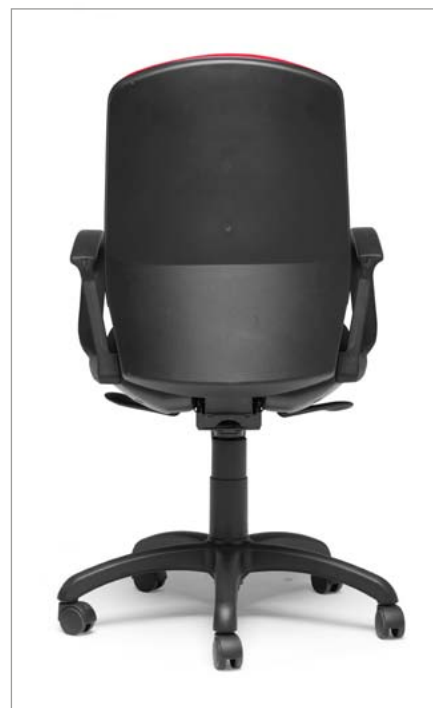
Ref: ML-01 + ML-PVC