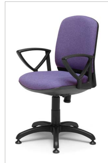
Ref: ML-05 + ML-PVC2 (Com retorno automático)