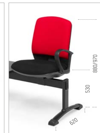
Ref: ML-TINR (ref. de pé)