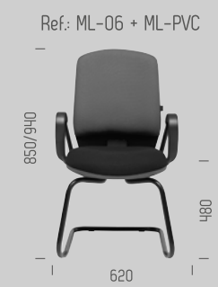
Ref: ML-06 + ML-PVC