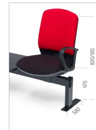
Ref: ML-TFXNR (ref. de pé)