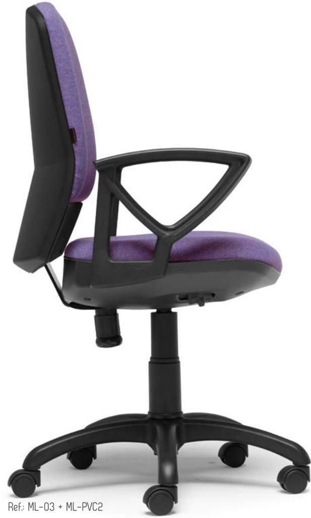
Ref: ML-03 + ML-PVC2