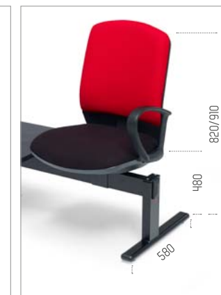
Ref: ML-TANR (ref. de pé)