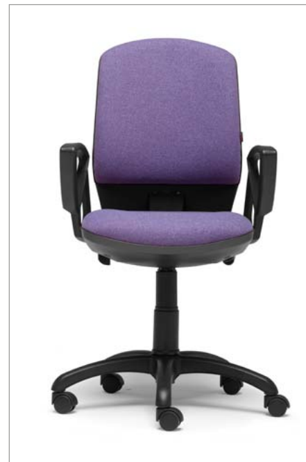
Ref: ML-03 + ML-PVC2