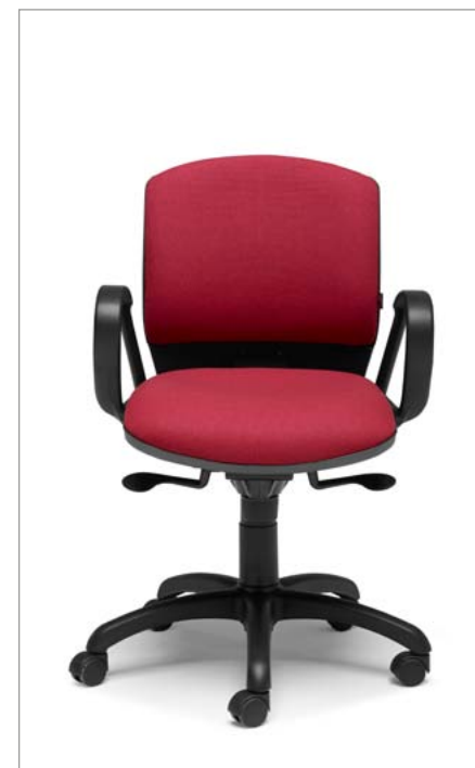
Ref: ML-02 + ML-PVC