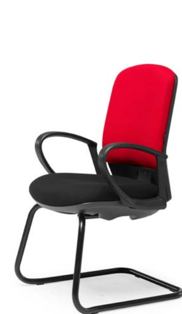
Ref: ML-06 + ML-PVC