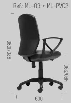
Ref: ML-03 + ML-PVC2